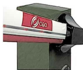
Lys i bomarm / blinklys