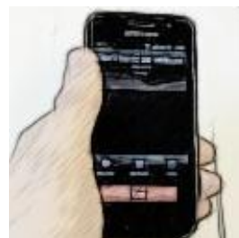
Åpning fra mobiltelefon