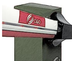
Lys i bomarm / blinklys